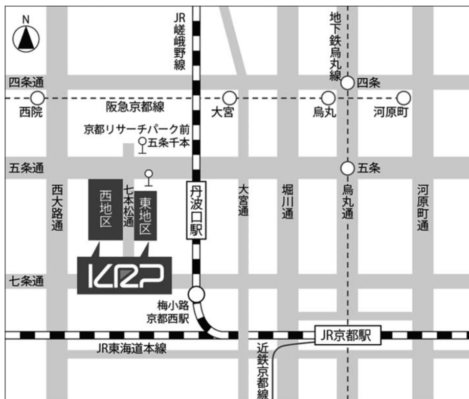
京都リサーチパーク (KRP) 案内図