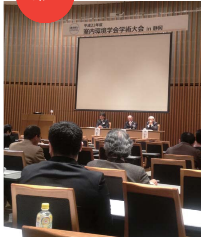
平成23年度室内環境学会学術大会